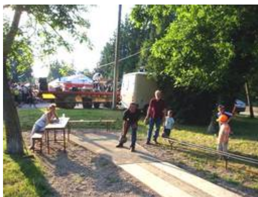
Saint Jean 2010 – concours de quilles