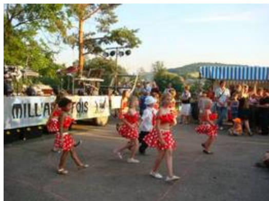
Saint Jean 2010 – club de danse